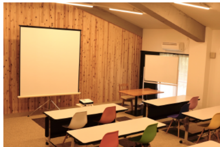
コワーキング (A) 約20名利用