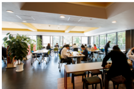
社員食堂「くおり亭」(1F) 平日のみ営業中 (昼・夜)